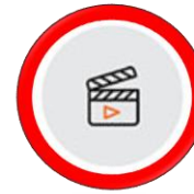
영상 촬영 및 편집