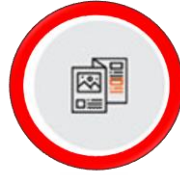
브로셔 디자인 / 프린팅