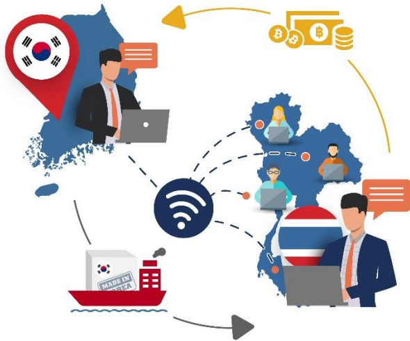
Online Personal Meeting at Thailand

온라인 1사 사절단은 기존 1사 사절단을 온라인으로 대체하는 프로그램으로, 기존의 시장성평가 및 홍보물 현지화를 통한 바이어 발굴 및 매칭은 동일하나, 바이어 미팅 시 태국으로의 직접 방문이 아닌, 디자인엠이 바이어 대행방문을 통한 화상상담으로 진행됩니다.